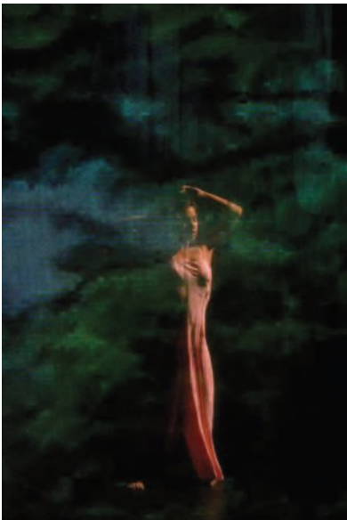
Silvia Farias dans Bamboo Blues. Théâtre de la Ville, Paris 2008. Prise de vue numérique. Tirage Fineart Canson Baryta 60x40.