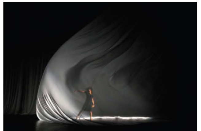
Sweet Mambo. Théâtre de la Ville, Paris 2009. Prise de vue numérique. Tirage Fineart Canson Baryta 60x90.