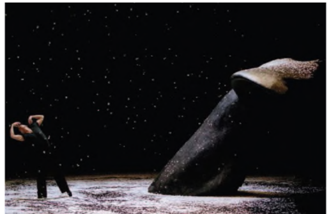
Ten Chi. Théâtre de la Ville, Paris 2005. Prise de vue argentique couleur. Tirage Fineart Canson Baryta 60x40.