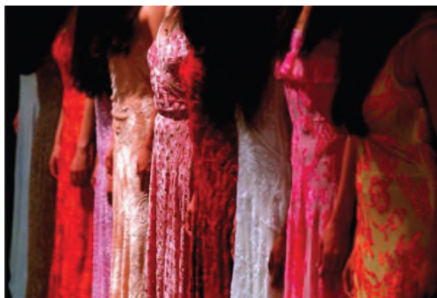
Nefes (costumes de Marion Cito). Théâtre de la Ville, Paris 2004. Prise de vue argentique couleur. Tirage Fineart Canson Baryta 60x90.