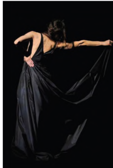
Sweet Mambo. Théâtre de la Ville, Paris 2009. Prise de vue numérique Tirage Fineart Canson Baryta 60x90